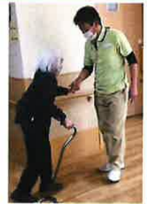
担当:リハビリ部門