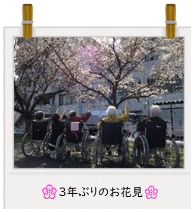
🌸 3年ぶりのお花見 🌸