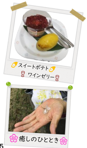
🍠 スイートポテト 🍷 🍷 ワインゼリー 🍷