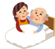
対応可能な医療行為一覧

施設生活中、思いがけず全身状態が低下し終末期を迎える方もいらっしゃいます。穏やかに安心して終末期が過ごせるよう支援していきます。